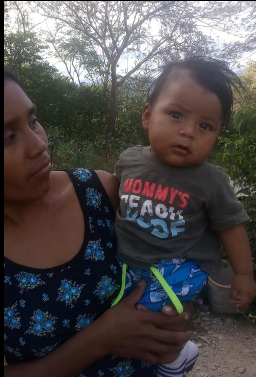
El último en llegar