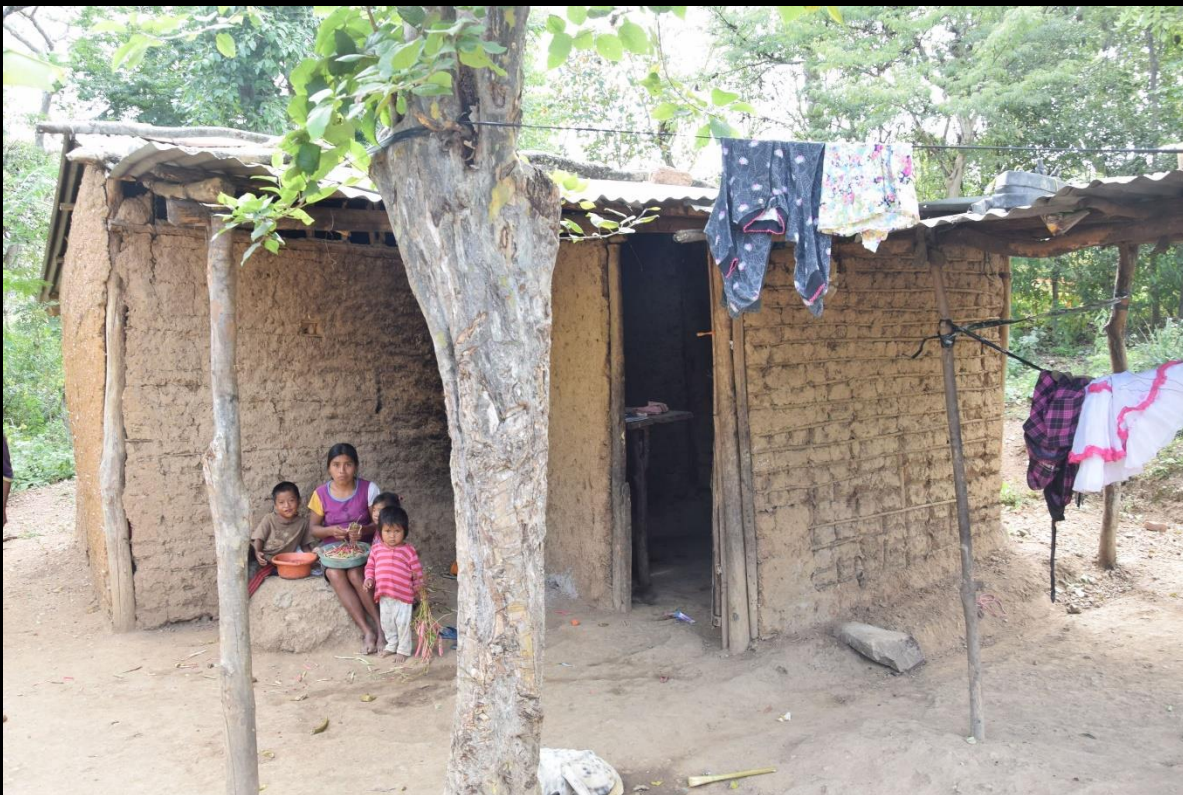
Etkezaharra eta familia