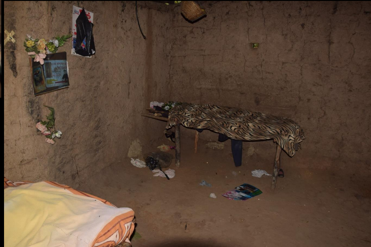
Barrutik etxea eta oheak Interior de vivienda y camas