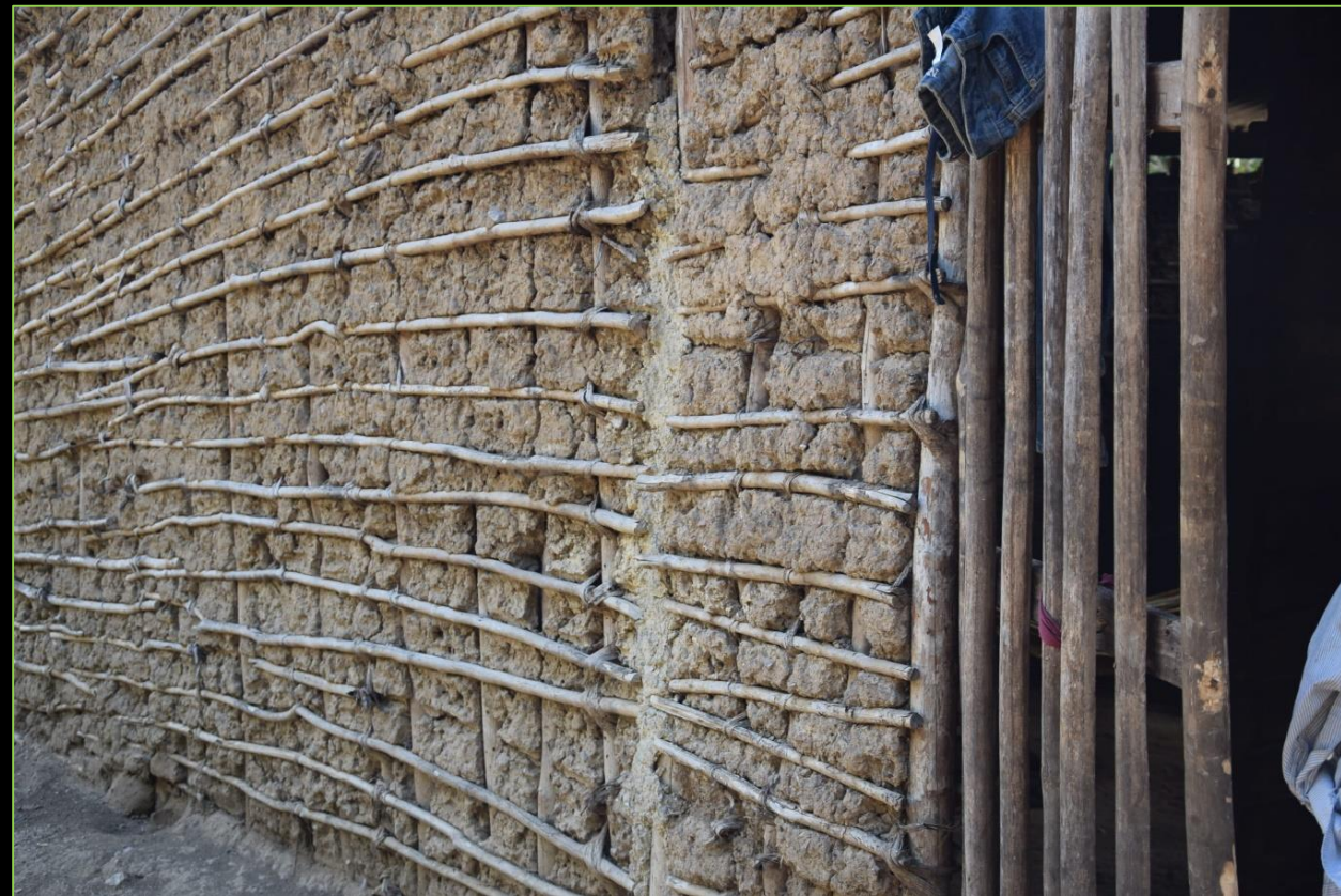
Paredes de la casa