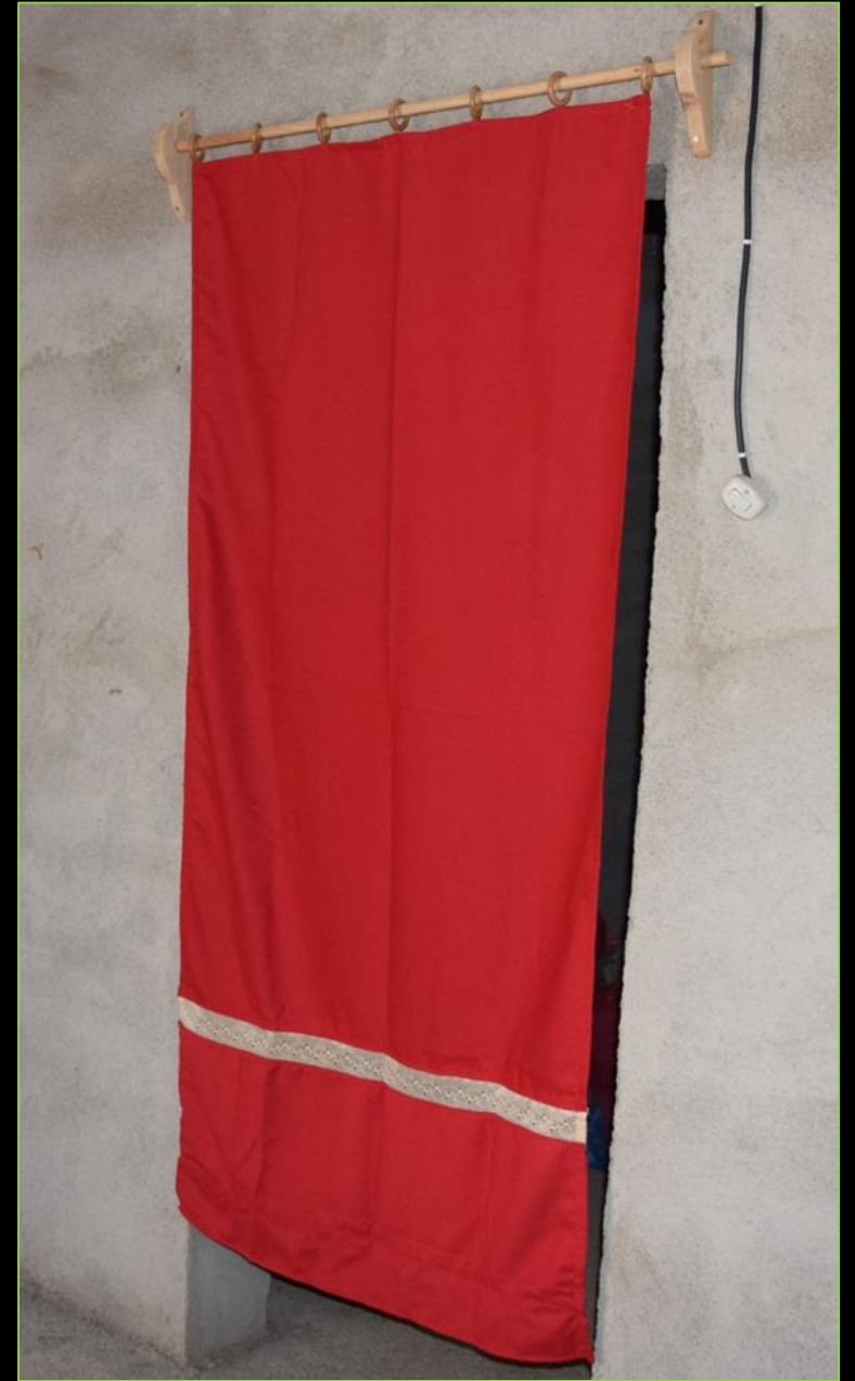
Puertascortina de las habitaciones