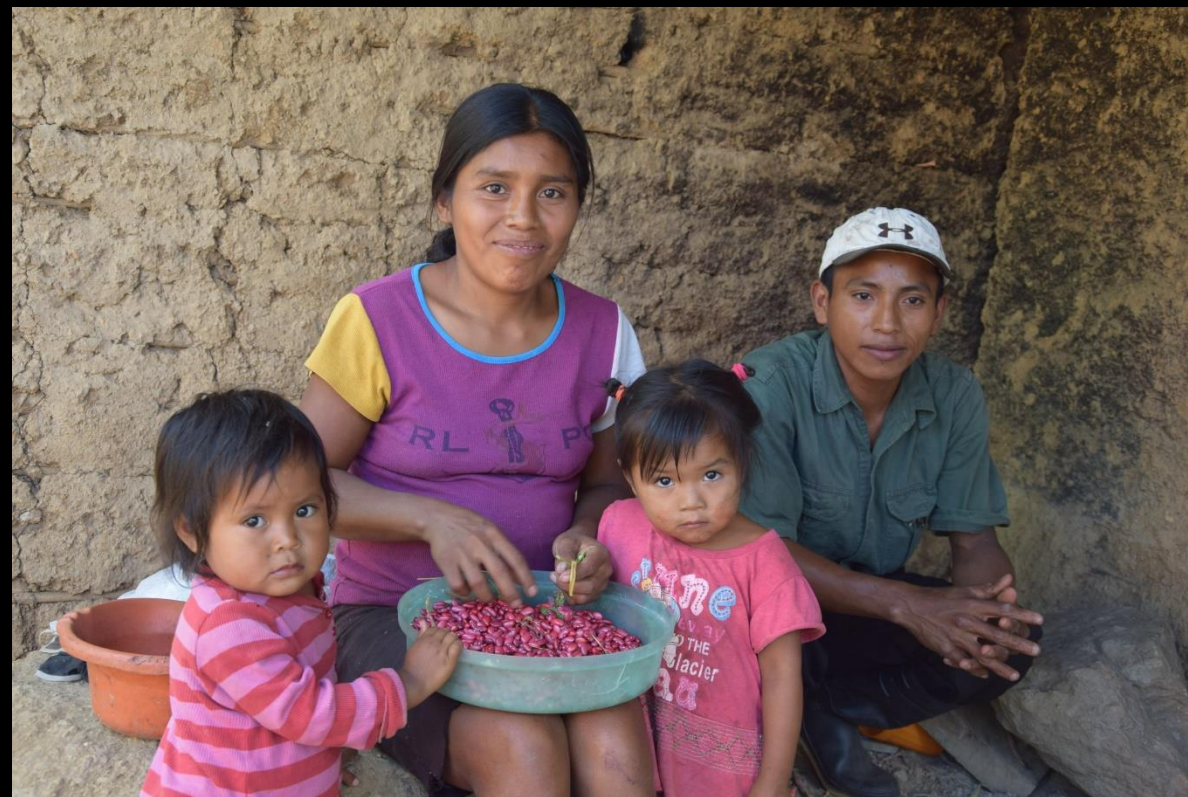
Casa vieja y familia