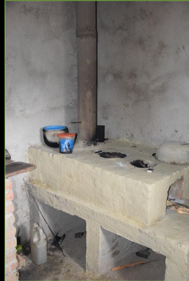
Sukalde berria eta tximinia Cocina nueva con chimenea