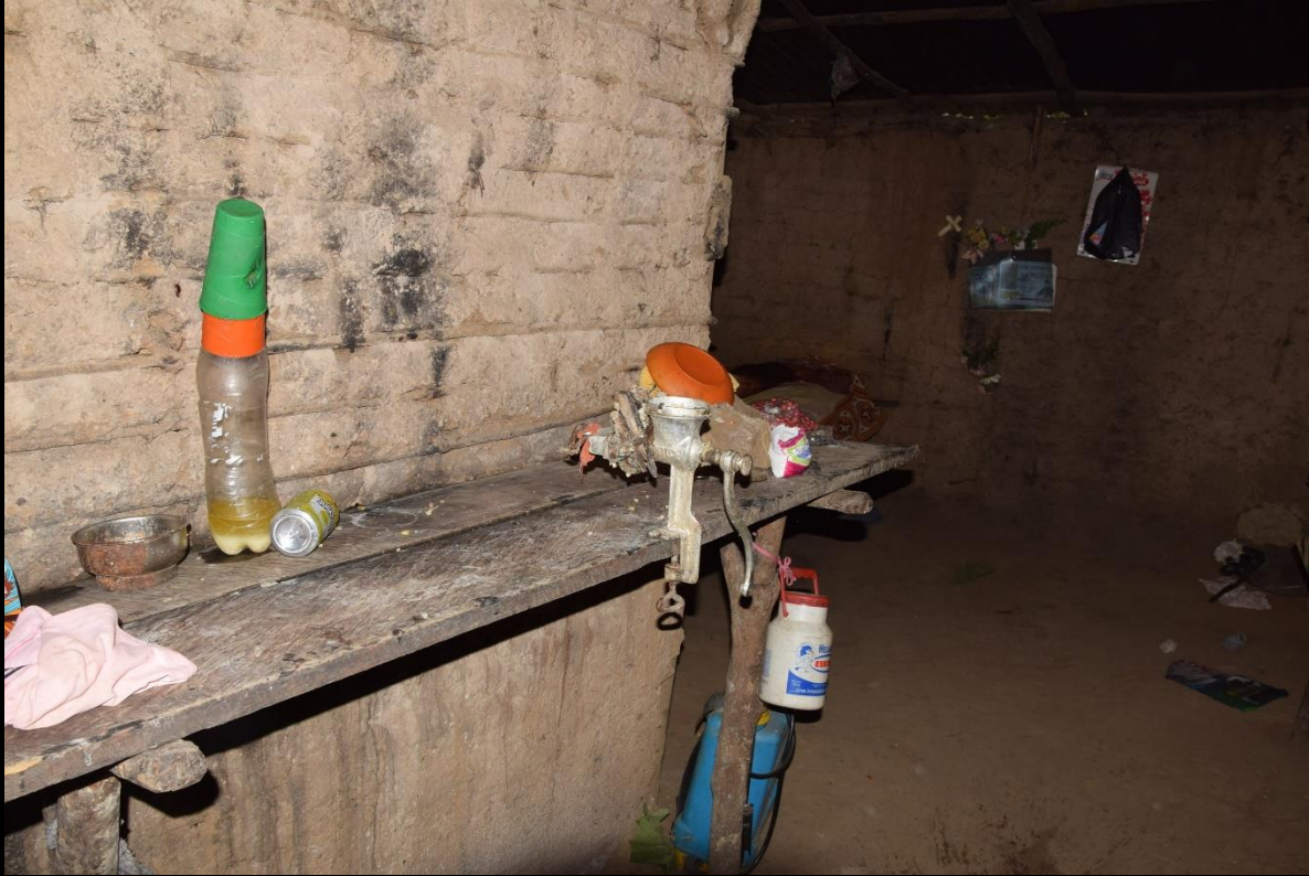
Cocina y techo