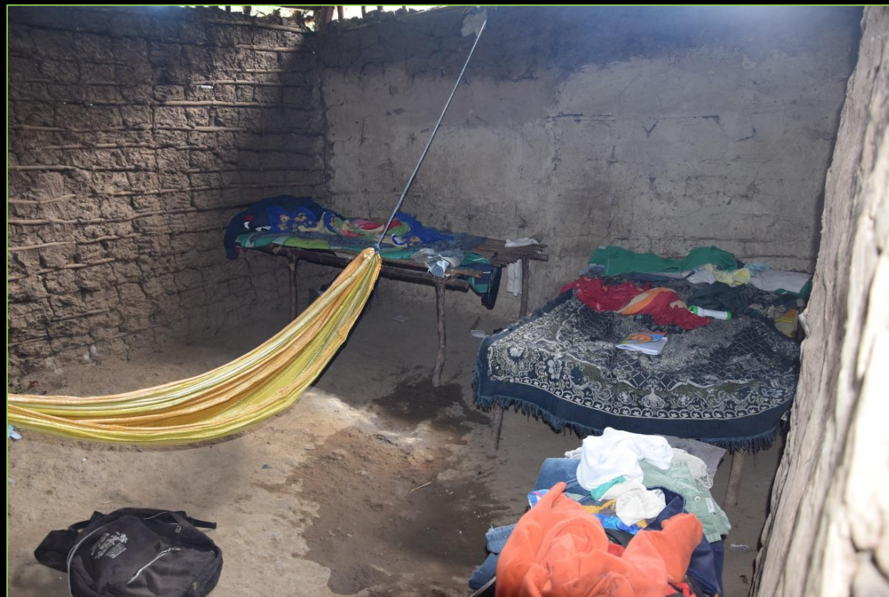
Gela bakarra Unica habitación